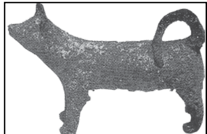
Kuva 8, Tämä hautaveistos muistuttaa meidän pystykorvaamme